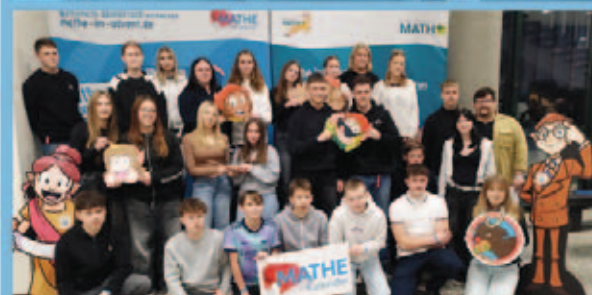
OS „Siegfried Richter“ Gröditz gewinnt erneut den 1. Platz bei „Mathe im Advent“