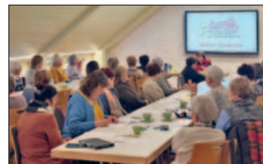
Märchenhaftes Lesecafé im Januar begeistert