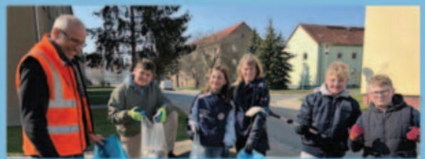
„Frühjahrsputz“-Aktion 2026 – Gemeinsam für ein sauberes Gröditz

Handball-Benefizspiel begeistert Gröditz