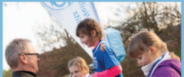
Kleine Läufer ganz groß beim Frühjahrs-cross