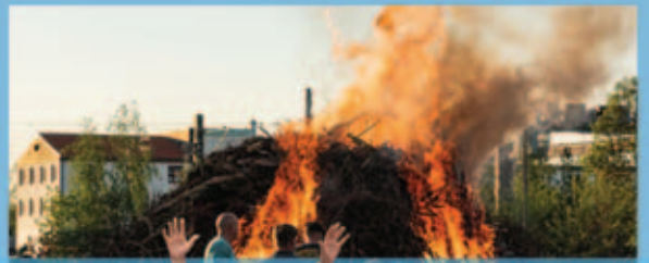
30.04.26: Lampionumzug & Maifeuer der Feuerwehr Gröditz